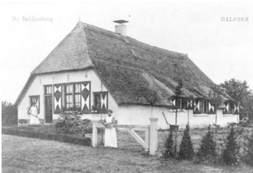
Bokkenberg