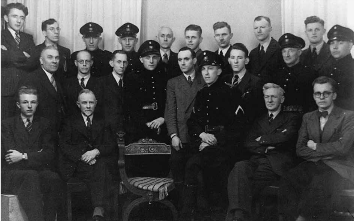
Het gemeentepersoneel op 1 maart 1943.