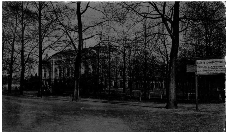
Buitensociëteit in Zwolle