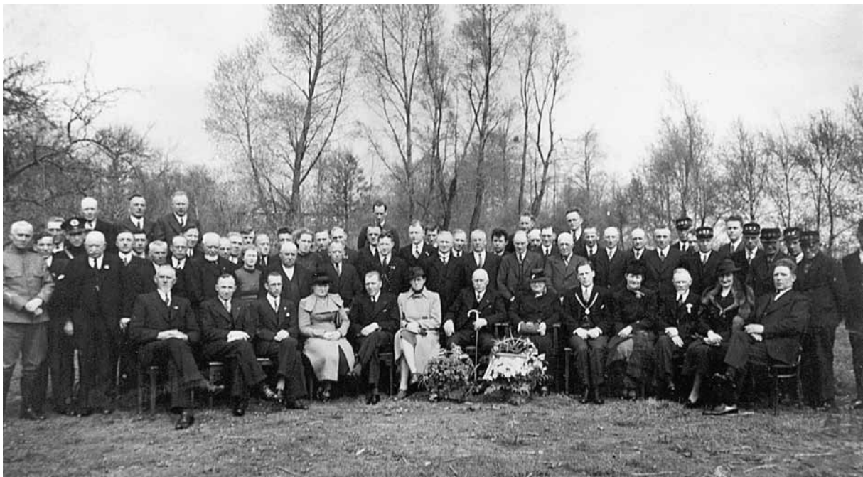
Het gemeentebestuur en -personeel in 1942. Deze foto is in de tuin achter de burgemeesterswoning aan de Esweg genomen.

Het eerste georganiseerde verzet in Beilen ontstond op het gemeentehuis in Beilen, waar ook na het vertrek van Wytema in oktober 1942 een anti-Duitse houding bleef. Met administratieve middelen werkte men de Duitsers zoveel mogelijk tegen. 17